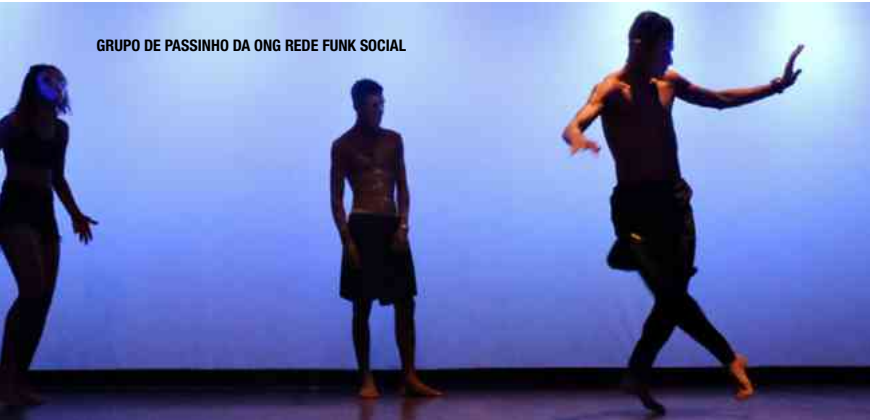
GRUPO DE PASSINHO DA ONG REDE FUNK SOCIAL

A exposição fotográfica tem como objetivo sensibilizar o público para a conservação da natureza. O visitante poderá admirar os registros fotográficos de alta qualidade das aves que habitam a Unidade.